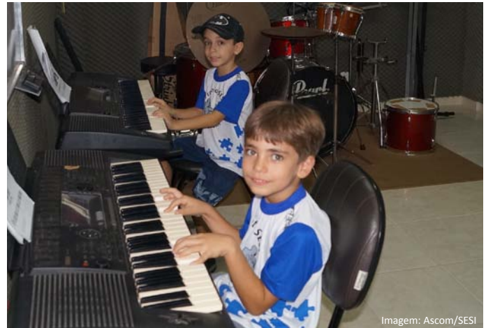
Alunos aprendendo a tocar teclado.

Já o Lazer Cultural oferece Musicalização com Teclado, Bateria, Violão, Prática de Banda e Teoria Musical. O Critério para fazer parte é ter 6 anos completos e disposição para aprender, ou seja, crianças, adolescentes, jovens, adultos e idosos podem se inscrever nesse projeto.