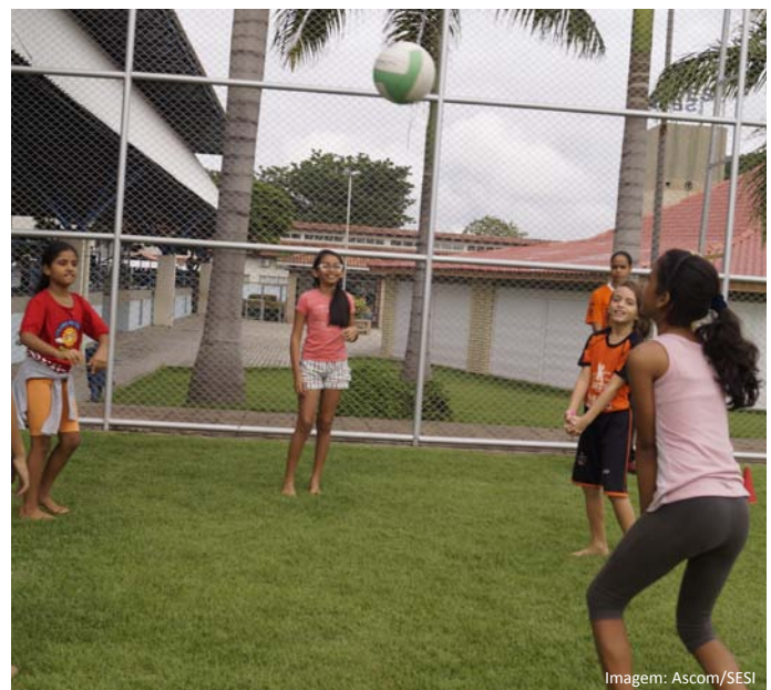
Crianças do projeto durante atividade recreativa

No mês de agosto serão realizadas as Avaliações Física e Atitudinal das crianças e dos adolescentes. A avaliação física é feita para mensurar o nível de força, resistência e coordenação motora, para, a partir do resultado, melhorar a capacidade física ao longo do programa. Já a Avaliação Atitudinal