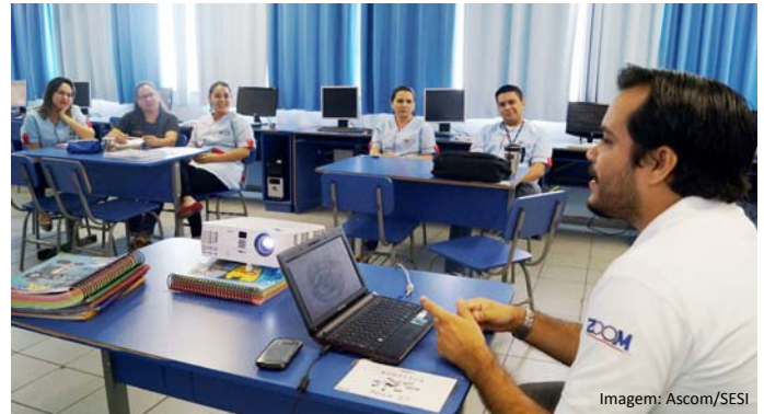
Professores de Robótica do Sesi aperfeiçoa conhecimento sobre a disciplina.

No período de 16 a 23 de junho os professores de educação infantil e ensino fundamental do Centro de Educação do trabalhador João de Mendonça Furtado – CET participaram do Programa ZOOM de educação tecnológica na rede Sesi, no laboratório de Educação Tecnológica da escola, das 19h às 21h30.