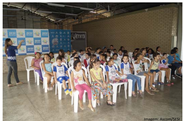
As crianças irão aprender novas receitas saudáveis

O Curso - O Turminha Sesi Cozinha Brasil, surgiu da necessidade de quebrar conceitos pré-formados de que legumes, verduras, e até talos, cascas e sementes não podem resultar em receitas apetitosas.